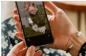
Chaque photo saisit un moment, mais la différence entre les personnes qui ont servi est aussi réelle aujourd'hui que le jour où elle fut prise.