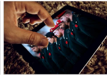
Pas sûrs de ce qui les attend, mais sûrs de leur engagement envers la paix.