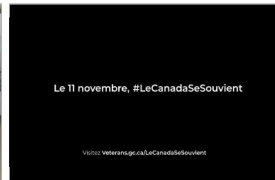
Le 11 novembre, #LeCanadaSeSouvient Visitez Veterans.gc.ca/LeCanadaSeSouvient.