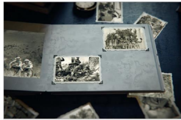
Un oncle, peut-être. Un grand-papa. Une grand-maman. Une sœur. Un neveu. Un enfant. Un parent.