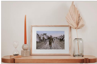
VO: Elles sont sur nos murs et nos étagères. Les photos.